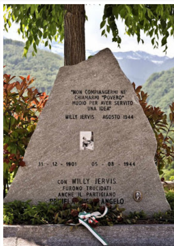
Cippo alla memoria di Jervis e altri partigiani

Una lettura di due libri su Willy Jervis. Una figura di valdese e di partigiano antifascista.